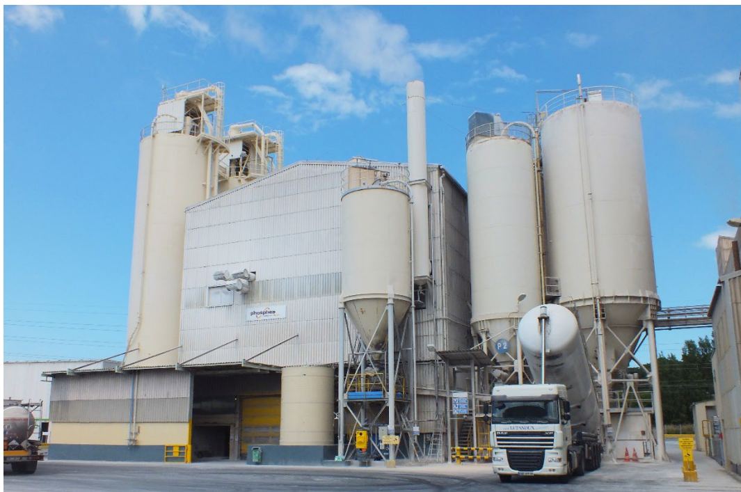
StMalo - Fábrica Phospha França

Vivenciar e tornar efetivas as disposições deste Código é conduta esperada de todos os colaboradores que devem conhecer e atuar conforme os padrões, políticas, regras e procedimentos orientados pela empresa e, também, seguir as diretrizes constantes e norteadas por este Código de Conduta. A reflexão sobre esse importante assunto, em suas mais variadas formas, conta com o comprometimento do Comitê Estratégico e do Comitê de Compliance do Grupo Roullier , expresso por meio deste Código.